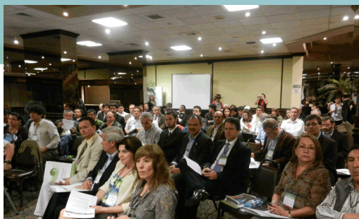
Aproximadamente 170 personas llegaron hasta el Hotel Boulevard