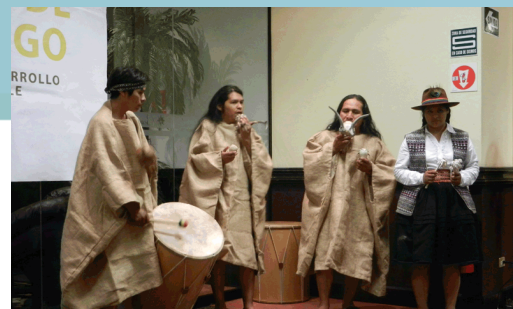
Música a cargo del Centro Cultural Supay Ruma