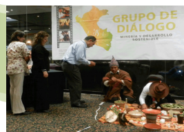
Algunos asistentes chaccharon hoja de coca como parte de la ceremonia.