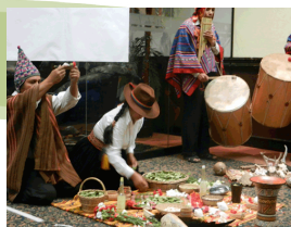
Ritual de Agradecimiento a cargo del Centro Cultural Supay Ruma