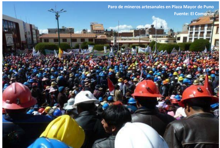
Paro de mineros artesanales en Plaza Mayor de Puno

El minero artesanal, según la propaganda, es el actor de medidas delictivas, de la prostitución infantil, de lavado de dólares, de impactos ambientales, cuando por su dimensión, los ilegales no tienen nada que ver con la minería artesanal en pequeña escala. Si aplicáramos el mismo criterio a otros sectores se diría absurdamente que Yanacocha es responsable del aumento de la prostitución en Cajamarca o aprobaríamos que se dinamiten los edificios en construcción porque existen los extorsionadores (bandas de delincuentes) a cambio de seguridad, o que se dinamiten los taxis porque son informales y pagan cupos. Esto sería injusto, porque los sectores delictivos van donde hay “mercado” para su actividad y actúan porque el Estado está ausente y no llega a controlar esas actividades.