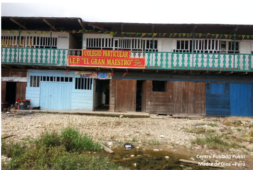
Centro Poblado Pukiri Madre de Dios - Perú

El traslado a Pukiri desde Puerto Maldonado toma alrededor de unas cinco horas. Buen tramo de la carretera es asfaltada, hasta el punto donde es necesario cruzar en bote para luego continuar en auto por un camino asentado. A la entrada de la localidad lo primero que vemos son casas de madera y calamina, mezcladas con las de aquellos menos que han decidido establecerse permanentemente y han levantado sus viviendas de cemento. Las calles son algo desordenadas, salpicadas por los colores de los abundantes comercios de comida y venta de abarrotes. No cuentan con servicios básicos, la luz eléctrica es por motor y el agua es sacada de pozos hacia un tanque elevado.