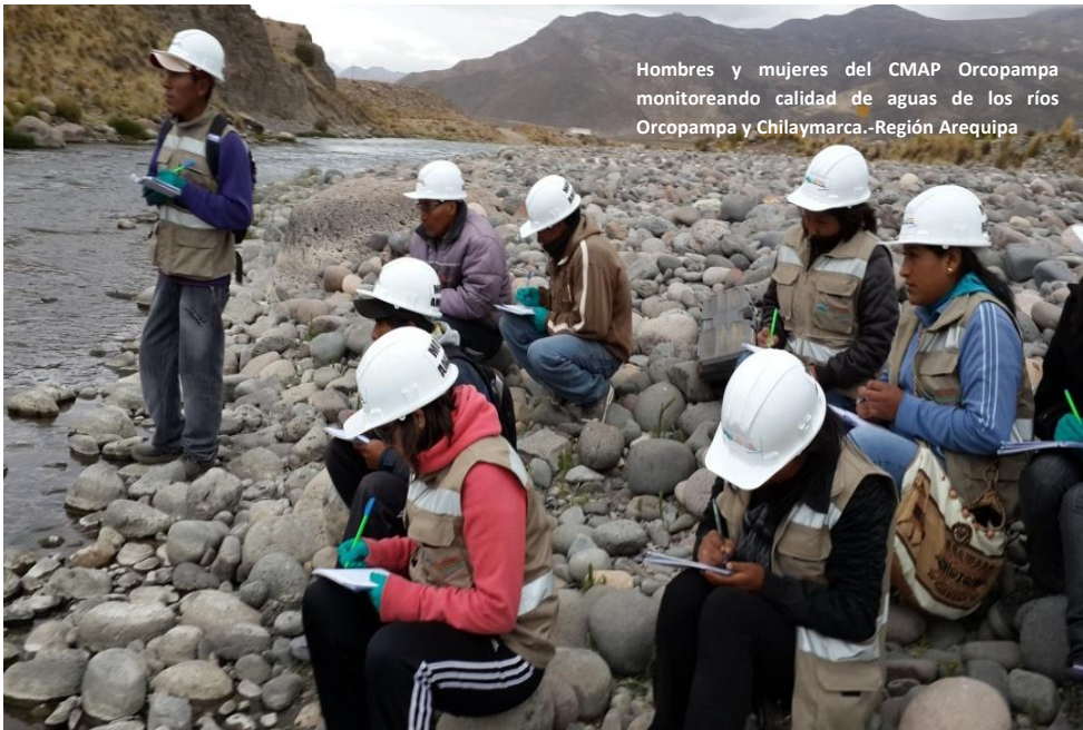
Hombres y mujeres del CMAP Orcopampa monitoreando calidad de aguas de los ríos Orcopampa y Chilaymarca.-Región Arequipa

La búsqueda de un recurso de minería de socavón exige destreza, esfuerzo, voluntad, perseverancia, buena visión en la oscuridad, intuición para seguir la beta. Con esas condiciones, el relacionamiento entre empresarios, inversionistas y mineros, muchos de éstos pertenecientes a la comunidad, y el aval del Estado, van abriendo caminos y galerías con celeridad por debajo de la tierra.