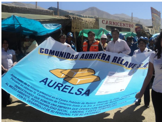
Directivos de la empresa de minería artesanal AURELSA

Cabe resaltar que esta sería la segunda certificación para AURELSA quienes debido a su compromiso y profesionalismo ya tienen el sello FT/FM también de Comercio Justo.