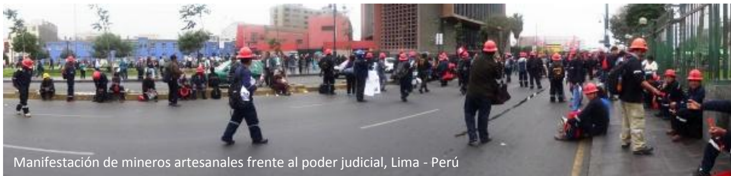
Manifestación de mineros artesanales frente al poder judicial, Lima - Perú

La interdicción a la minería ilegal es una necesidad porque son sectores delincuenciales que se han instalado en las áreas mineras ante la ausencia del Estado durante muchos años y su combate debería apuntar a los actores que financian y no sólo a las maquinarias. El minero artesanal y el pequeño minero es una víctima de la presencia de los ilegales, sin embargo cuando en los medios se nombra a los mineros, todos reciben el calificativo de ilegales.