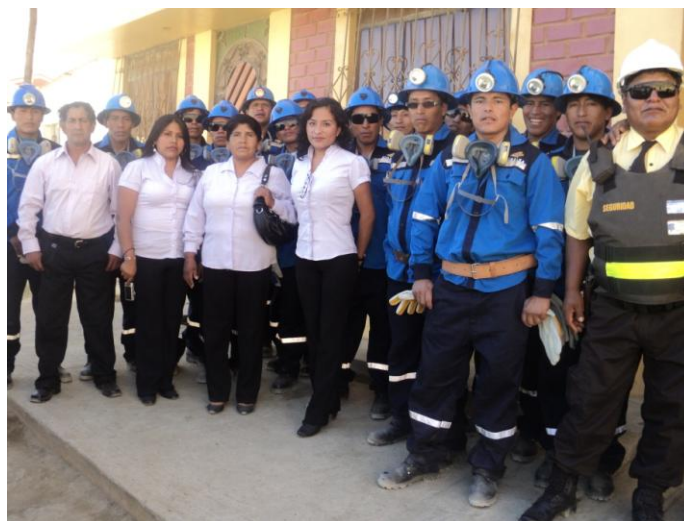
Trabajadores de la empresa de minería artesanal AURELSA