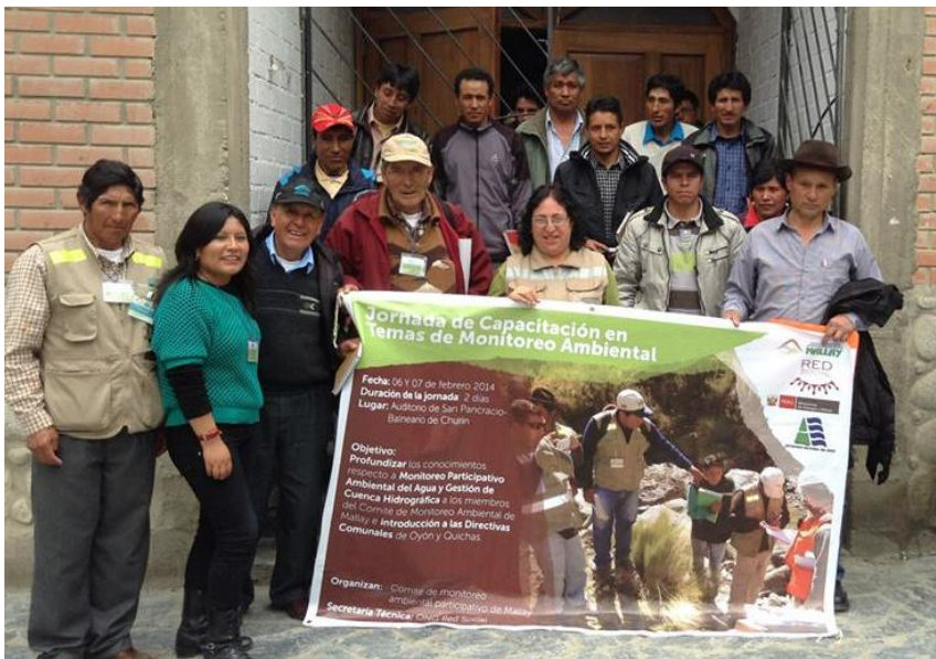
Participantes de la Jornada de Capacitación en temas de Monitoreo Ambiental realizado el 6 y 7 de febrero del 2014 en Churín - Perú

El uso del agua que la empresa hace para sus actividades en las poblaciones directamente impactadas por la minería, el desigual acceso a las oportunidades y subsistencia de niveles de pobreza; la percepción que no participan de los beneficios que dicha actividad genera elevan el nivel de conflictividad social.