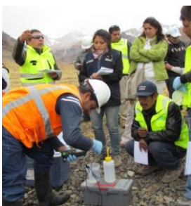
Miembros del CMAP de Tapay en pleno monitoreo del Río Tambomayo, Región Arequipa

La Empresa. En Mallay hay una opinión favorable al CMAP en tanto ha empoderado a la población en el cuidado del medioambiente.