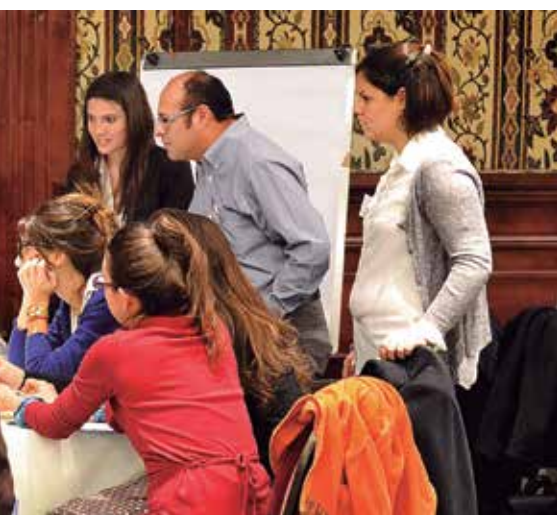
Foto superior: IV Encuentro de Diálogo Latinoamericano (Colombia, 2014).

A partir de un trabajo participativo y constructivista, se realizó una dinámica de trabajo entre los integrantes del GDL durante el taller en Lima el 24 y 25 de febrero del 2015, y se establecieron numerosos temas de interés, los cuales pudieron agruparse en tres grandes ejes temáticos. Una vez replanteados desde una mirada amplia, fueron puestos a consideración de los integrantes del GDL por vía electrónica para sus comentarios y aportes. De estos dos momentos se ha podido replantear una fórmula que condense lo esencial de las ideas y aportes vertidos dando lugar a la propuesta de tres temas a ser sistematizados durante la presente consultoría, lo cual se refleja en la tabla I: