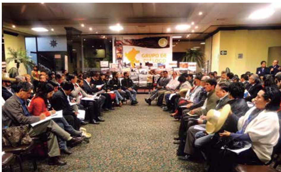
Grupo de Diálogo, Minería y Desarrollo Sostenible de Perú.

En aquellas iniciativas de diálogo, de comprobarse que aún no existen las condiciones suficientes para la apertura o la sostenibilidad del espacio, es recomendable conformar un grupo impulsor para contar con el soporte estratégico que demanda el inicio o la gestión de cualquier proceso de diálogo.