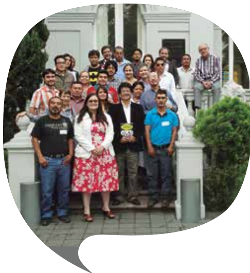
Grupo de Diálogo Minero Mexicano