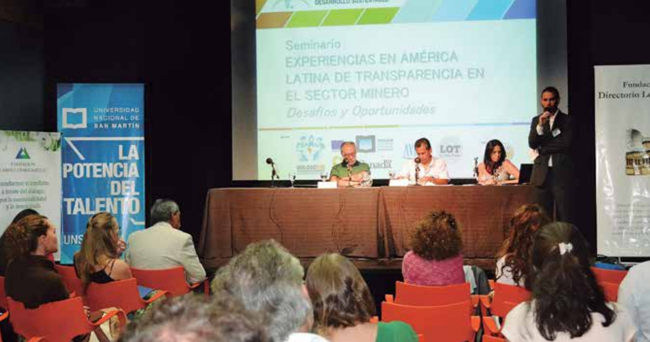
Plataforma Argentina de Diálogo "Minería, Democracia y Sostenibilidad".