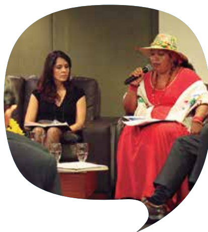
Mesa de Diálogo Permanente (Colombia).

También se indica que el haber tenido participación y voz en los foros internacionales donde el GDL fue invitado, ha permitido que se dé mayor importancia a temas referidos a la gestión de conflictos, consulta previa, una nueva visión sobre la minería como contribuyente al desarrollo sostenible. Igualmente, la presencia del GDL en espacios como la conferencia anual PDAC de Canadá, tan reconocidos por las corporaciones mineras y entidades internacionales, está generando la posibilidad que otros actores vean que existen espacios de articulación regional impulsados desde la sociedad civil, que no solo discutan sobre temas técnicos referidos a la industria sino que incluyan la tecnología social como un elemento consustancial a la actividad minera. Del mismo modo el GDL ha venido impulsando directamente la discusión de temas de interés común en los distintos países como: participación y consulta, el rol del Estado, ordenamiento ambiental, aporte al desarrollo local renta minera y evaluación ambiental estratégica.