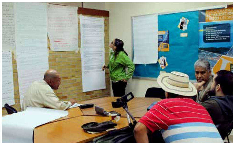
Trabajo en grupos - Grupo de Diálogo de Panamá: “Por el desarrollo responsable de los recursos minerales”

al fomentar espacios de encuentro con la participación de todas las voces que colaborativamente puedan construir nuevas visiones o “narrativas” sobre minería y desarrollo, y que además tenga la capacidad de influir en círculos de poder político, donde se toman decisiones que lleven al cambio de políticas en temas referidos a la relación Estado-empresas-comunidades. Si bien los