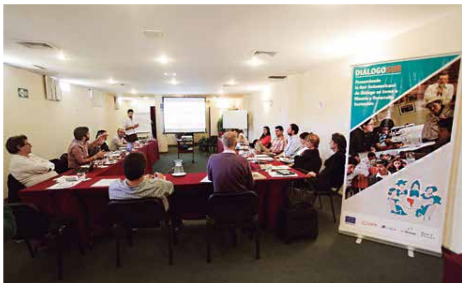
Reunión de coordinación del GDL realizada en Lima - Perú.

Brasil, Colombia, Chile, Ecuador y Perú. Esto implicó realizar visitas a tres países (Chile, Colombia y Argentina), previa coordinación con la institución impulsora del espacio de diálogo nacional, evaluando la viabilidad para conocer el espacio nacional de diálogo y/o entrevistar a una muestra representativa de participantes de sus respectivos integrantes. En el caso peruano, se revisaron los documentos referidos al Grupo de Diálogo, Minería y Desarrollo Sostenible, que cuenta con quince años de existencia.