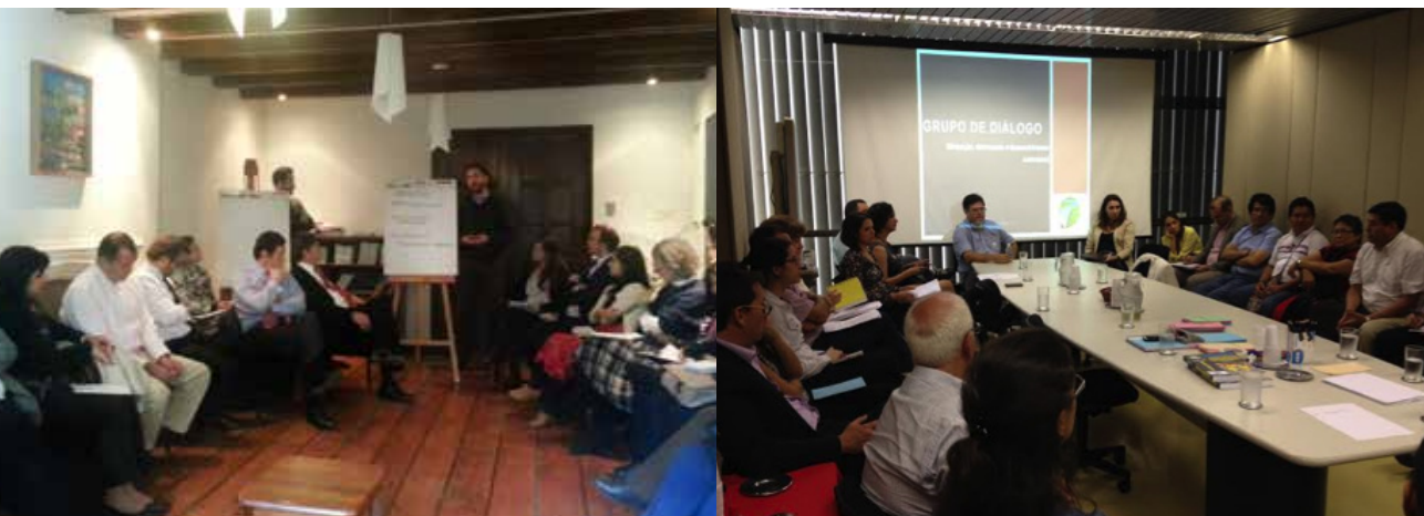
Izquierda: Plataforma de Diálogo, Minería y Desarrollo Sostenible (Chile)

Por tanto, la relación entre el GDL y los espacios nacionales es una relación muy cercana y recíprocamente dependiente. Los integrantes del GDL reconocen que el grupo tiene como razón de ser la existencia de los espacios nacionales de diálogo, sin estos o con espacios nacionales débiles el GDL se vería debilitado. De otro lado, el GDL cumple con dar soporte a los espacios nacionales y fortalecer los nexos en el plano internacional al tratarse de una instancia supranacional.